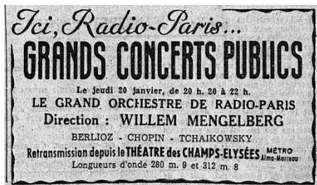
Le Matin, 19 januari 1944