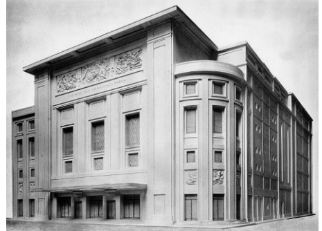
Théâtre des Champs-Élysées, Avenue Montaigne, Parijs

Mengelberg was in Parijs geen onbekende. Zijn eerste optreden daar dateert van 1907 bij het Orchestre Colonne. Op dat eerste Parijse concert zouden er tot en met 25 juni 1944 58 andere volgen: 24 werden met het Concertgebouworkest gegeven, de andere met verschillende Parijse formaties, waaronder tussen 1942 en 1944 29 concerten met het Grand Orchestre de Radio-